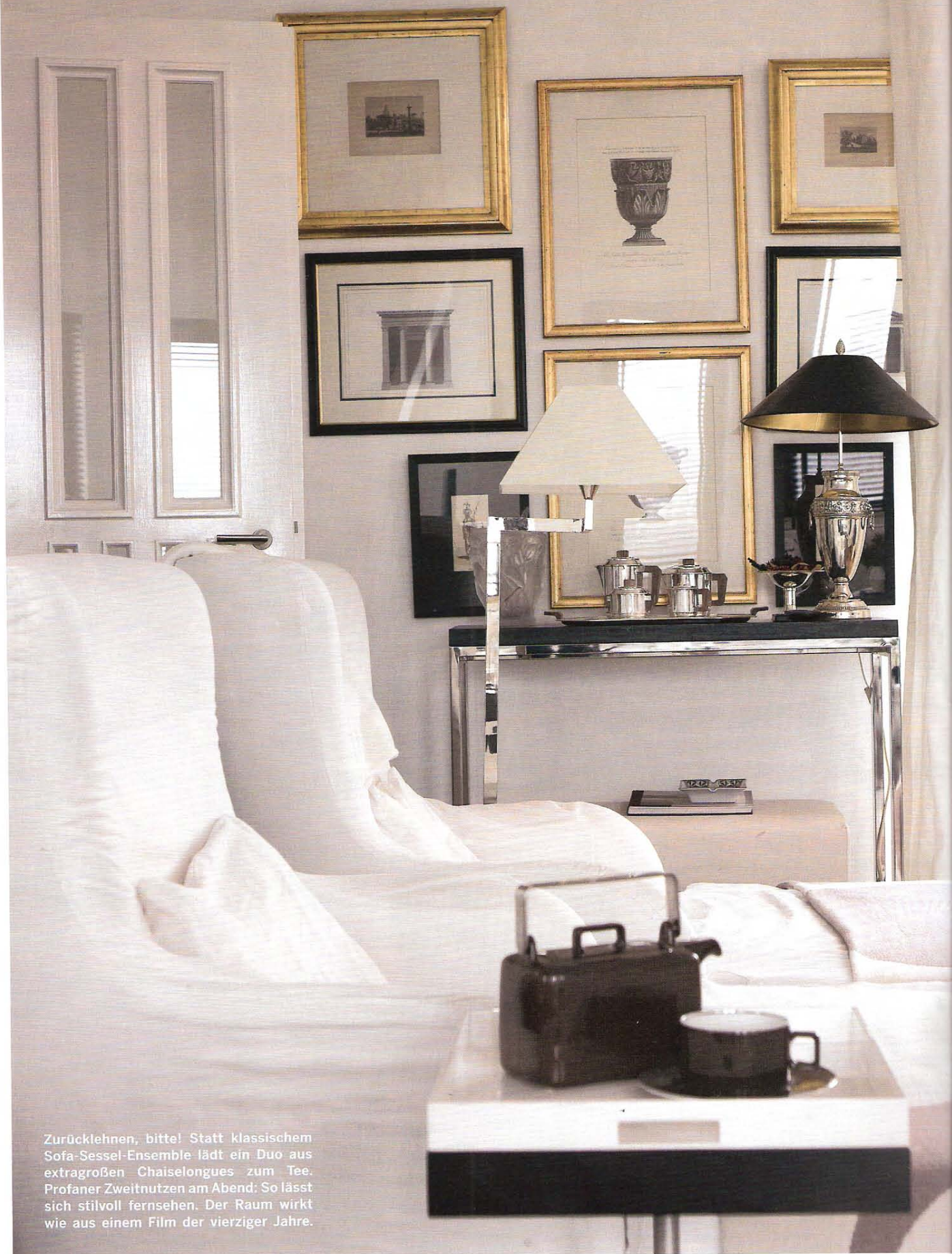
Zurücklehnen, bitte! Statt klassischem Sofa-Sessel-Ensemble lädt ein Duo aus extragroßen Chaiselongues zum Tee. Profaner Zweitnutzen am Abend: So lässt sich stilvoll fernsehen. Der Raum wirkt wie aus einem Film der vierziger Jahre.